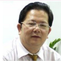
朱耿洲 著名融资策划专家 香港大学金融课程教授