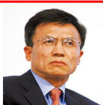
许小年 著名经济学家 中欧国际工商学院教授