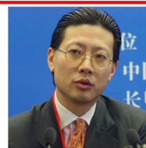
沈南鹏 红杉资本执行合伙人 携程网及如家酒店创始人