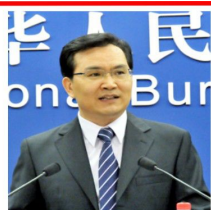
盛来运 国家统计局新闻发言人 国民经济综合统计司司长