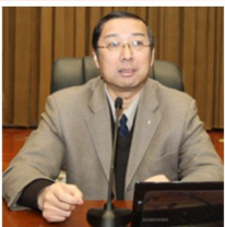
谈民宪 著名经济学家 西安交大教授、博导