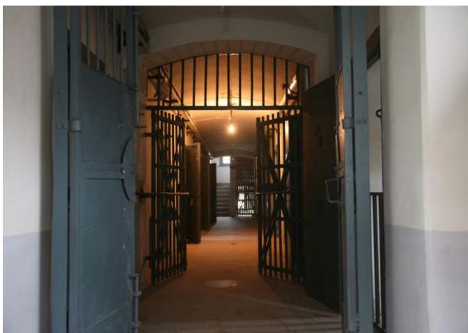
左图为德国时期监狱铁

该监狱旧址是全国现存唯一一处欧洲古堡式殖民监狱，是德国和日本帝国主义侵略青岛的历史见证。2006 年被列为“全国重点文物保护单位”，2007 年 4 月正式对外开放，馆内设有“青岛近代司法历史沿革陈列”、“监狱旧址历史场景复原陈列”两个展区，是爱国主义和法制教育的特色场馆，国家 AAA 级旅游景区。