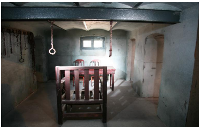
左图为监狱地下刑讯室

青岛德国监狱旧址博物馆位于青岛市市南区常州路 21 号，占地面积 8220 平方米，建筑面积 5022 平方米。监狱旧址建筑群由“仁”、“义”、“礼”、“智”、“信”监房和监狱工场组成。其中，作为监狱主体和标志性建筑的“仁”字监房建成于 1900 年德国占领青岛时期，其余监狱建筑为二十世纪 20、30 年代相继所建。